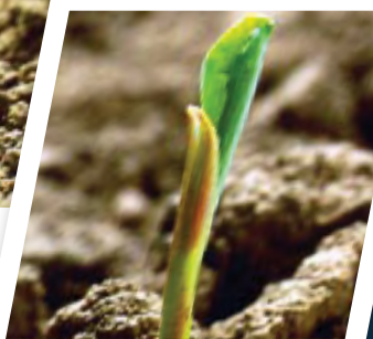
Die 1ste ware blare verskyn vanuit die koleoptiel