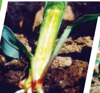
Groeipunt & Pluim – reeds bo die grondoppervlak